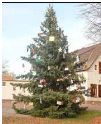
Tannenbaum zum Weihnachtsmarkt in Stumsdorf 2021

möchten wir alle Bürgerinnen und Bürger am 1. Advent (27.11.2022), ab 15.00 Uhr recht herzlich einladen.