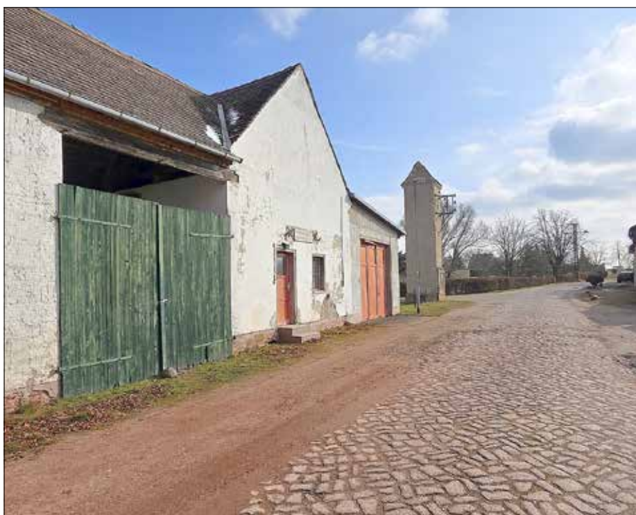
Abbildung 2 „Alte Feuerwehr“