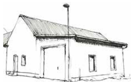
Abbildung 1 Skizze der „Alten Feuerwehr“

Verwendungszweck: „Alte Feuerwehr“ Göttnitz/Löbersdorf